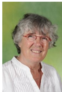
Juf Ali Groep 5/6