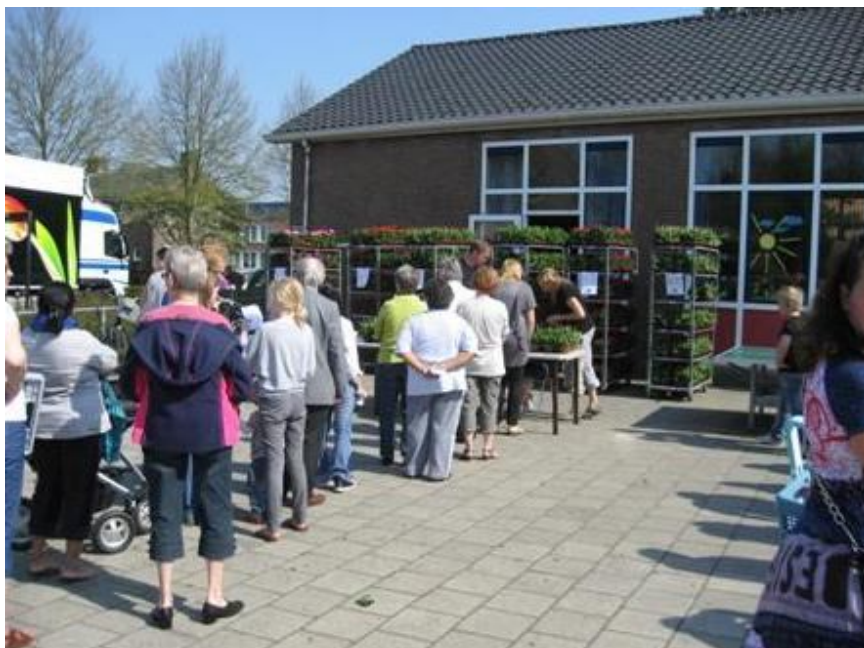
Geraniumactie de Ouderraad

De namen en adressen vindt u achter in de schoolgids.